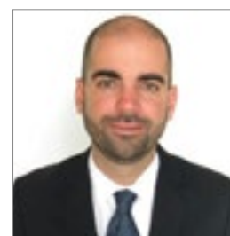
Bernat Vicens FERGUS HOTELS www.fergushotels.com