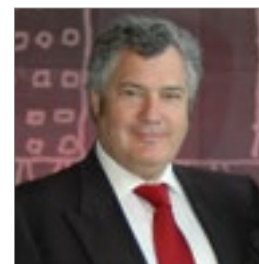
José Luis Santos HOTELES SANTOS www.h-santos.es