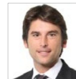
Andrés Soldevila SANT FRANCESC HOTEL SINGULAR www.hotelsantfrancesc.com